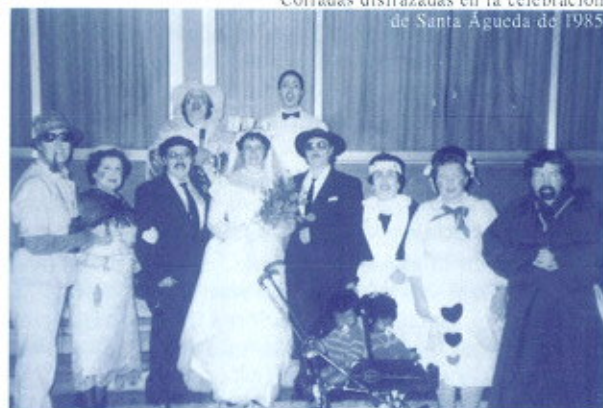
Cofradas disfrazadas en la celebración de Santa Agueda de 1985

Todo esto no puede perderse, como Mayordomas de este año os invitamos a que acudáis a los actos que se realizan, desde la misa y la procesión, hasta el baile, al que pueden acudir todos: maridos, niños, jóvenes, mayores, ... Todos juntos pasaremos unas jornadas divertidas.