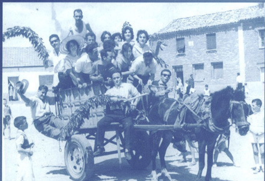
Imágenes de la Plaza cuyo fondo es la esquina que da a la calle del Río.