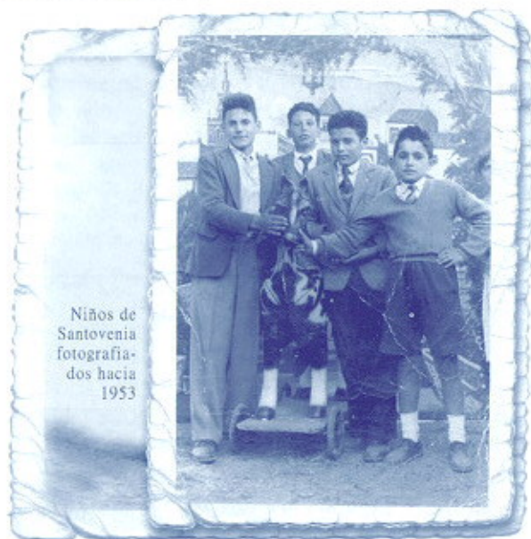
Niños de Santovenia fotografía- dos hacia 1953